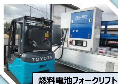
燃料電池フォークリフト