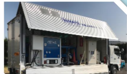
移動式水素ステーション

このたび、滋賀県では、移動式水素ステーションを用いた燃料電池フォークリフトへの水素巡回供給実証を実施します。併せて、下記のとおり水素エネルギー利活用に関するセミナーおよび実証現場の見学会を開催いたしますので、ぜひご参加ください。