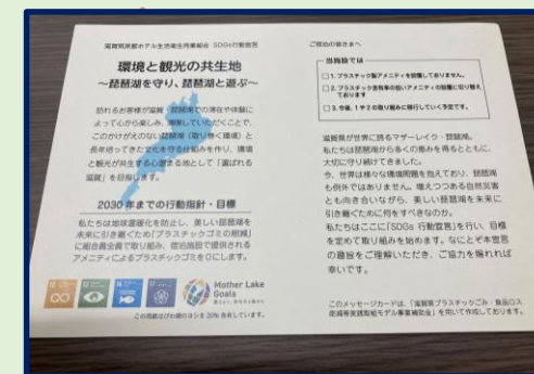
部屋置きメッセージカード